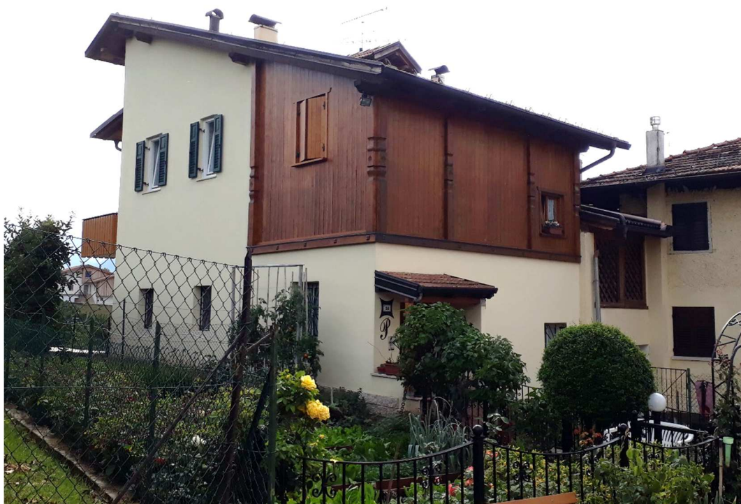
Vista da est