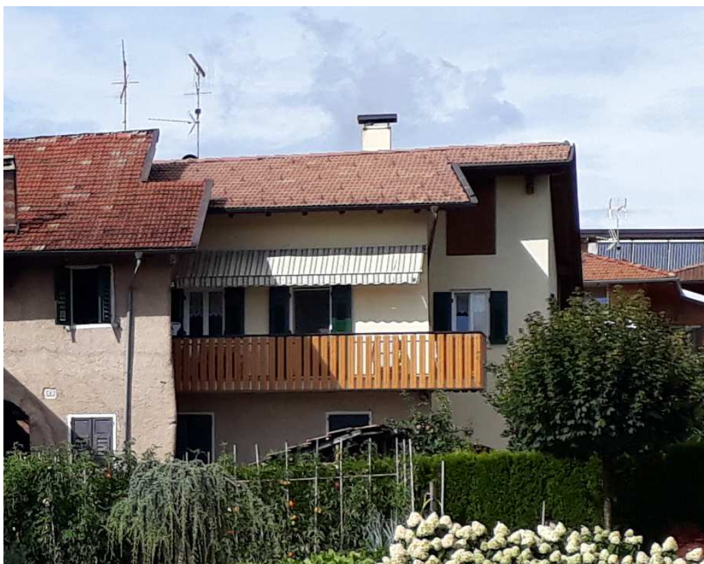
Vista da sud